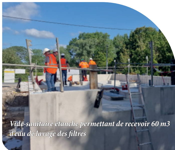
Vide-sanitaire étanche permettant de recevoir 60 m 3 d'eau de lavage des filtres