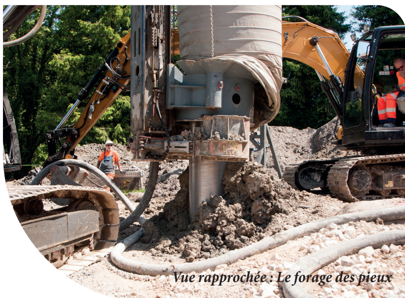
Vue rapprochée : Le forage des pieux

dier les possibilités d'interconnexion avec les collectivités voisines et de comprendre plus précisément le fonctionnement du système de distribution d'eau potable de Desvres.