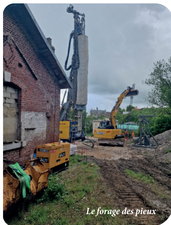
Le forage des pieux

Ressource naturelle jusqu'à présent abondante en France, l'eau douce est utilisée à des fins domestiques (eau potable...) et économiques (agriculture, industrie, loisirs...). Des mesures réglementaires visent à garantir une gestion équilibrée de la ressource en eau et à la partager lorsqu'elle se raréfie. D'autres mesures visent aussi à améliorer la qualité de l'eau en réduisant les pressions.